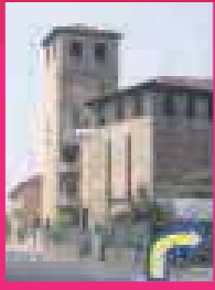
DIETRO AL CASTELLO

TEMPORARY OUTLET DAL 3 APRILE AL 30 GIUGNO