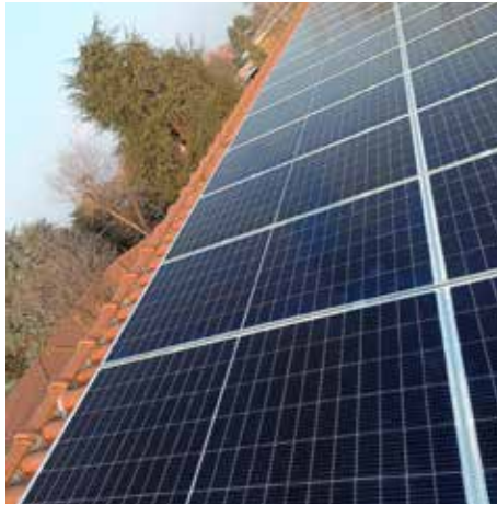
Nuovo impianto fotovoltaico