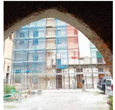
Lavori al Castello

da via delle Betulle e uscita su via San Nazzaro. A queste opere si aggiunge il completamento del marciapiede a nord di via San Nazzaro , che si raccorderà a quello esistente in modo tale da favorire la sicurezza della mobilità pedonale. I lavori in capo al Comune sono finanziati per 190.000 euro da oneri per urbanizzazioni e per una restante parte di 50.000 euro da stanziamenti di bilancio dell'ente. Il completamento delle opere è previsto per la fine dell'estate. Entro l'estate, e comunque al termine dei lavori di posa della fibra e conclusione del cantiere privato al civico 6, è inoltre previsto il rifacimento completo del manto d'asfalto dell'intero tratto iniziale di via San Nazzaro.