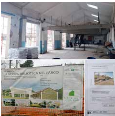
La nuova Biblioteca nel parco

È entrato nel vivo il cantiere per la realizzazione della sede stradale di via delle Betulle, la nuova strada perpendicolare a via San Nazzaro in prossimità di via dei Pini. Oltre alle opere legate alla nuova strada (che includono specifici interventi al sistema fognario e la posa dei sottoservizi) è prevista la realizzazione di una nuova area parcheggio per un totale di 19 stalli di sosta con ingresso