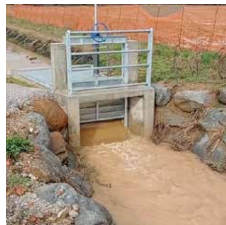
Il Parco dell'Acqua