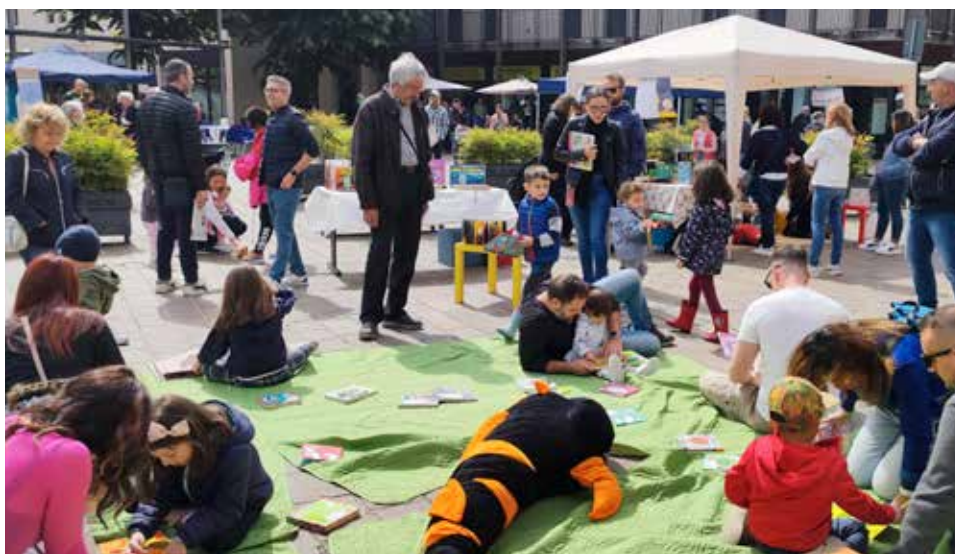
La Piazza del Libro edizione 2023