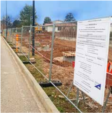
Via delle Betulle