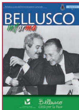
In copertina: i giudici Falcone e Borsellino