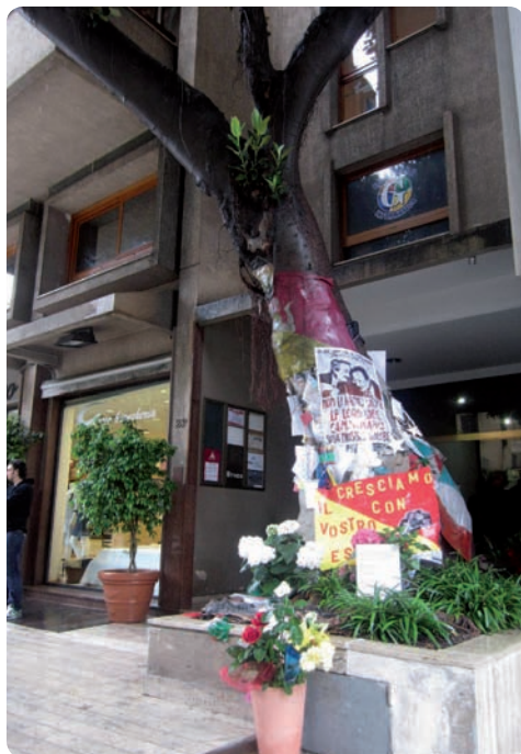
Il Ficus posto dinanzi al palazzo di via Notarbartolo a Palermo dove abitavano Giovanni Falcone e Francesca Morvillo