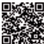
Inquadra con il tuo smartphone il codice QR per andare alla pagina del sito dedicata al "Bellusco Informa".