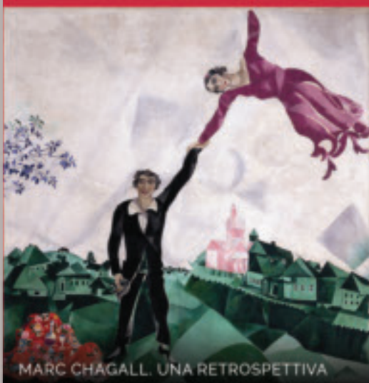
MARC CHAGALL. UNA RETROSPETTIVA

Un tuffo nel passato (dettaglio), 2014 pittura acrilica su legno, 50 x 80 cm