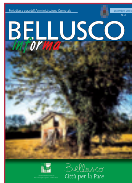
In copertina: paesaggio agricolo di Bellusco