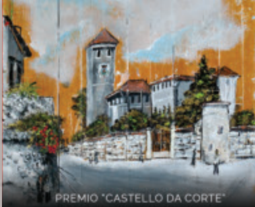
PREMIO "CASTELLO DA CORTE"

In attesa di scoprire un nuovo tassello della storia locale, l'Associazione Culturale Art-U prosegue le esplorazioni artistiche allargando lo sguardo all'arte moderna europea: nel periodo invernale propone visite guidate alle mostre su Marc Chagall e Vincent Van Gogh a Palazzo Reale (Milano)... e molti altri eventi su tutto il territorio! (per informazioni: www.artuassociazione.org - info@artuassociazione.org ). ►